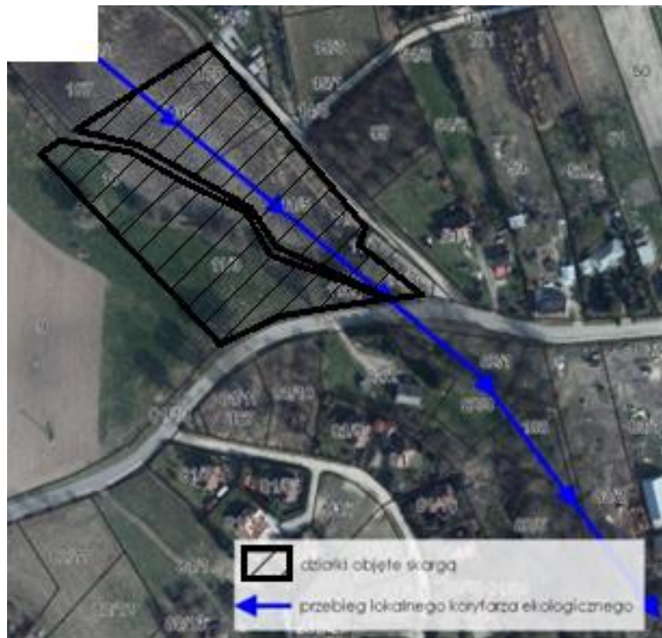
Ryc. 4. Przebieg lokalnego korytarza ekologicznego.

krajobrazowych oraz byłyby niezgodne z wytycznymi ochrony środowiska wskazanymi w studium.