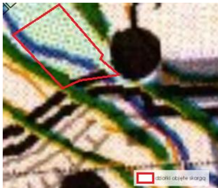
Ryc. 5. Granica działek, będących przedmiotem skargi na tle mapy hydrograficznej.

Należy również wskazać, że zgodnie z mapą hydrograficzną, przedmiotowe nieruchomości charakteryzują się występowaniem wysokiego poziomu wód podziemnych, co wpływa niekorzystnie na możliwości zabudowy tego terenu. Położenie działek na tle mapy hydrograficznej ukazuje poniższa ryc. 5.