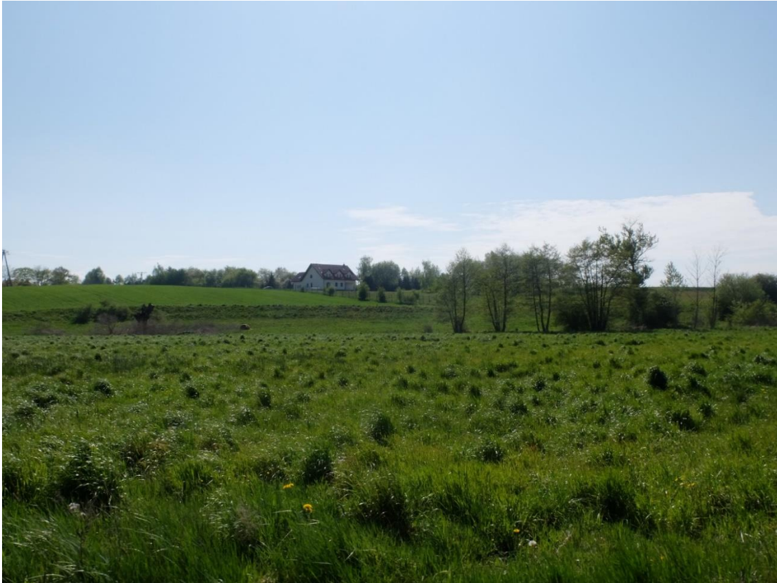
Ryc. 1. Widok na teren 1.80-ZK od strony drogi 1.07-KDD.