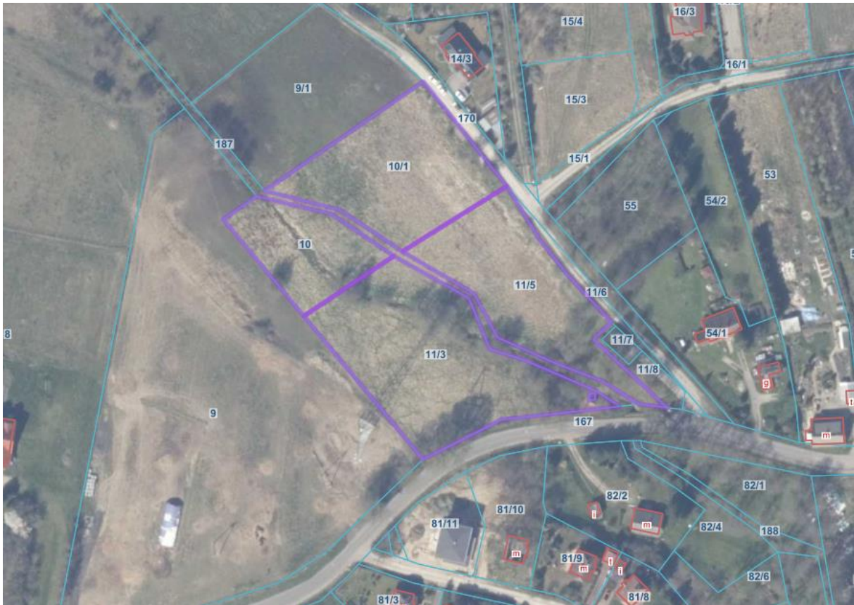
Ryc. 2. Granica działek, będących przedmiotem skargi na tle ortofotomapy oraz mapy działek ewidencyjnych.